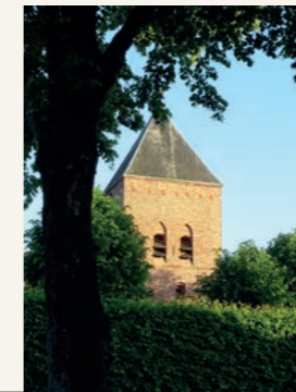
Vormgeving en fotografie: Alie Goeree

De toren, opgetrokken uit kloostermoppen en rustend op een fundering van zware veldkeien, dateert uit de 14e eeuw en is 27 meter hoog. De in 1949 geplaatste klok verving een klok uit 1501. De ouderdom van het uurwerk wordt geschat op ruim 300 jaar. Het bouwjaar van de kerk is niet meer te achterhalen. Wel is bekend dat deze kerk was gewijd aan Sint Willebrordus en dat in 1666 de 'Ridderschap van Eigenerfden' 150 Carolus gulden beschikbaar stelde voor de restauratie van dit gebouw. Het rooster, dat het kerkerf scheidt van de Hoofdstraat, belette loslopende varkens het kerkhof te betreden. In de volksmond heette het, dat het rooster 'de duivel met zijn bokkepoten' moest weren. Terugwandeling naar het Hunebedcentrum komt je een etagelinde K , de oude schaapskooi L en de dorpspomp M uit 1875 tegen.