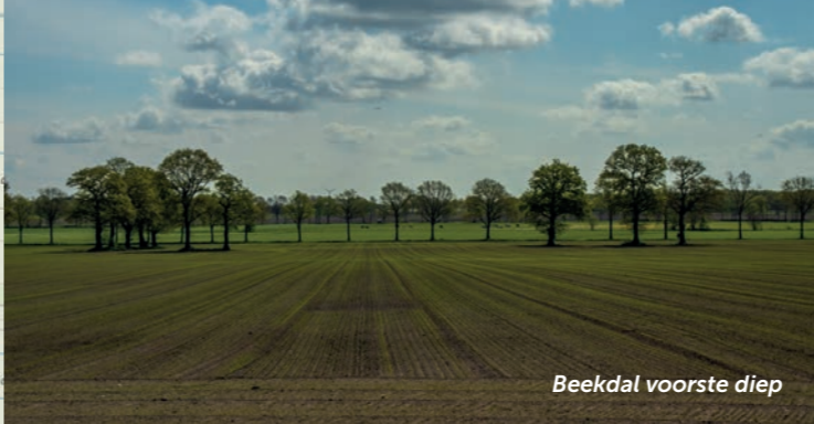
Beekdal voorste diep